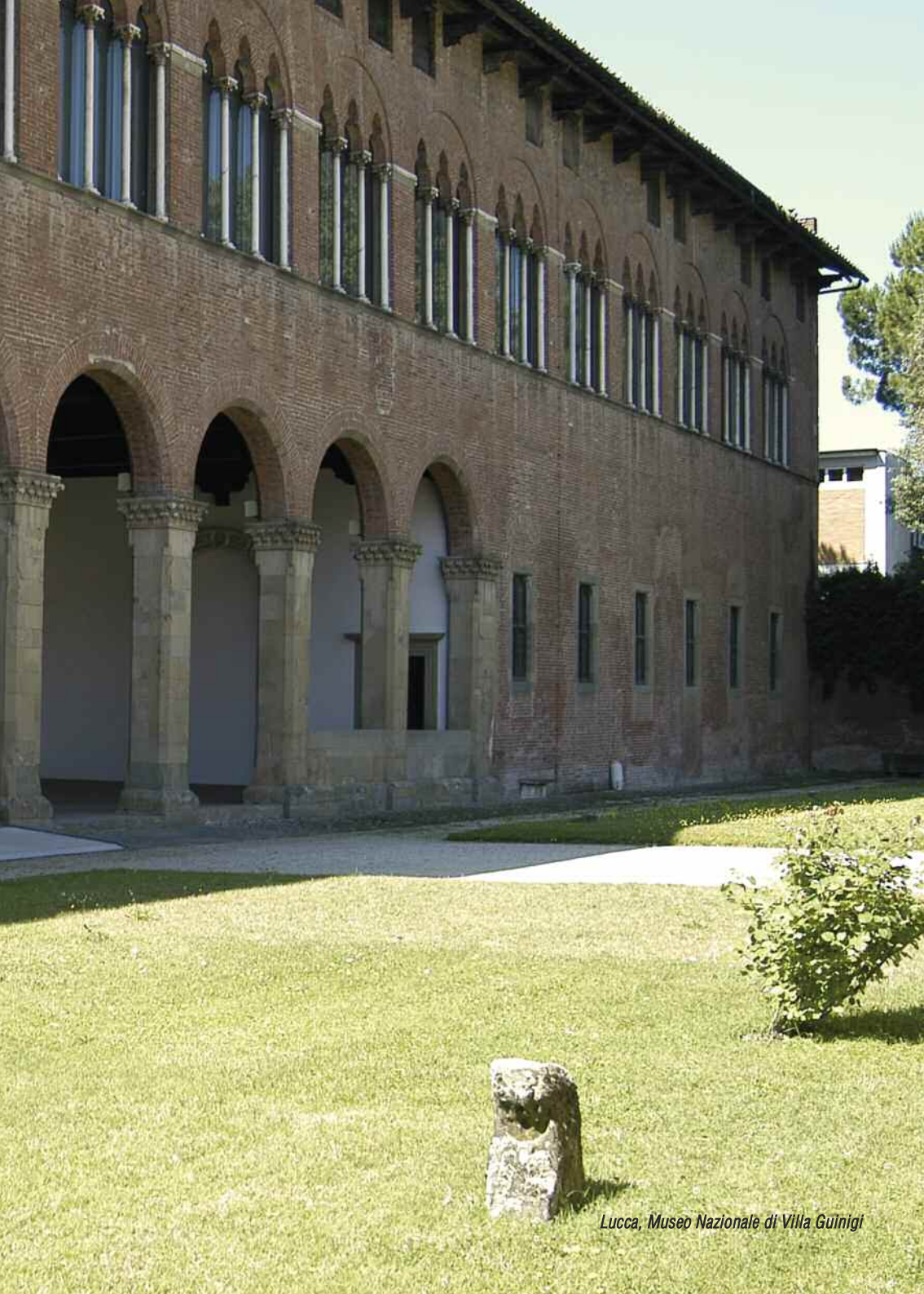
Lucca, Museo Nazionale di Villa Guinigi